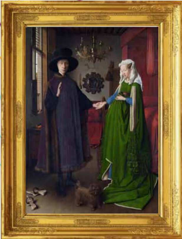
Jan Van Eyck – 1389-1441 – HOLLANDA

Sanatçının bu resmi tarihi açıdan da bir ilk olma özelliğine sahip. Bu tablo, evlenme anının resmedilmesi nedeniyle, bir nevi 'evlilik cüzdanı' niteliğinde. Eseri bu kadar önemli kılan detay ise ayna. Duvardaki ayna, müthiş bir akis tekniğiyle anı derinleştirmek için kullanılmış. Aynaya dikkatlice bakıldığında, Van Eyck'ın da resmin içinde olduğu görülür. Ressam, kendini 'an'a dâhil ederek, resim sanatına farklı bir boyut kazandırdı.